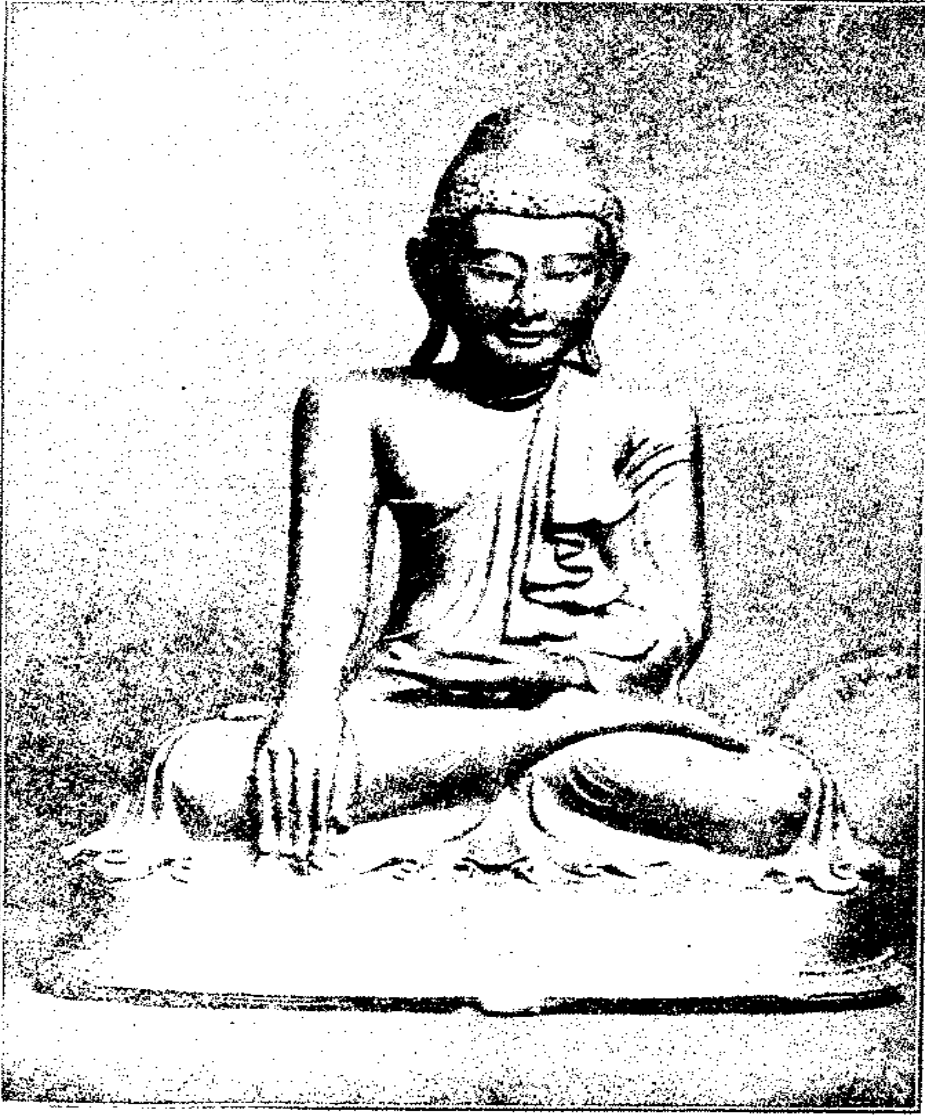
صورة تمثال بوذه جالساً يتأمل وهو من النحاس (البرنز) مرصع بالحجارة الملونة حول رأسه