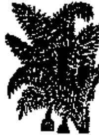
جدول هذا البحر

ينقل (عاذلاتي) الى عاذل بسكون اللام الصورة الثالثة للعروضة ان تكون محذوفة اي دخلها الحذف كما تقدم ومخبونة اي دخلها احد الزحافات المفردة وهو الحين فتقل (فاعلاتن) الى (فعلن) بتحريك العين فتكون العروضة هي ينقل (عاذلينا) الى (عذلا) بتحريك الذال وفي هذه الحالة اما ان يكون الضرب مماثلاً لها اي محذوفاً مخبوناً ويكون ينقل (عاذلاتي) الى (عذلا) بسكون الالف وتحريك ما عداها واما ان يكون ابر اي ينقل (عاذلاتي) الى (عاذل) بسكون اللام