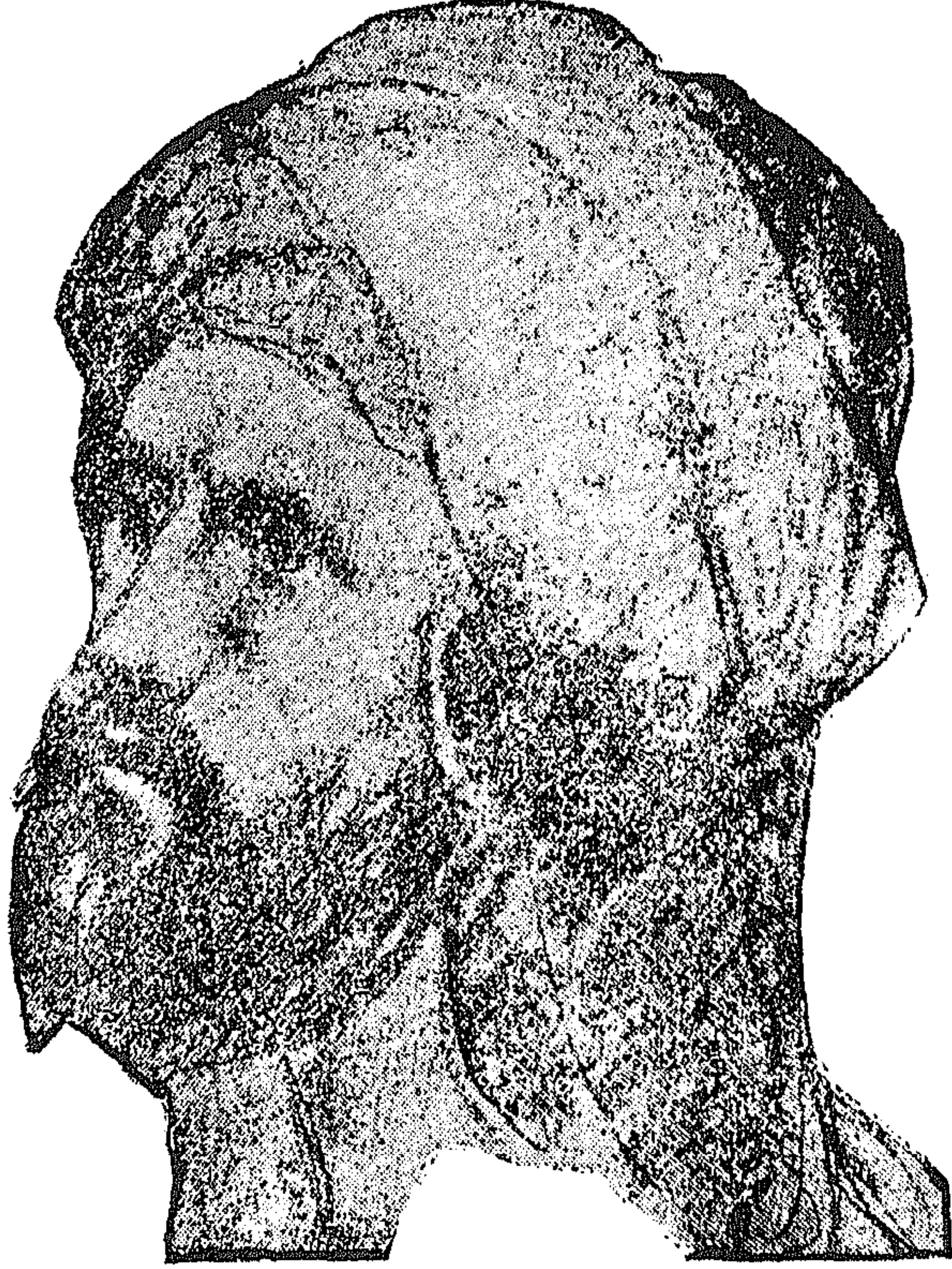
ديك الجن الحمصي