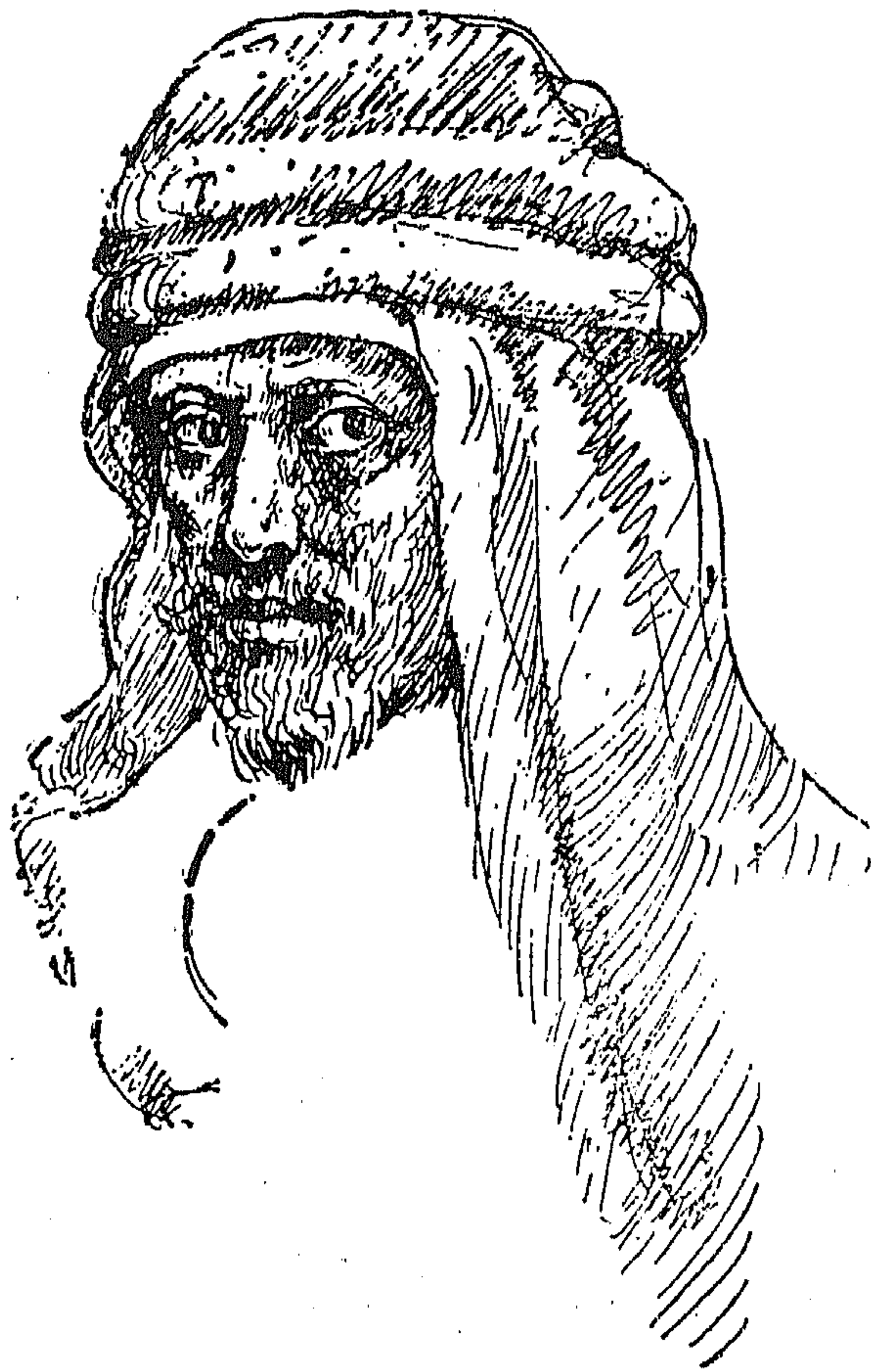
أبو الطيب المتنبي