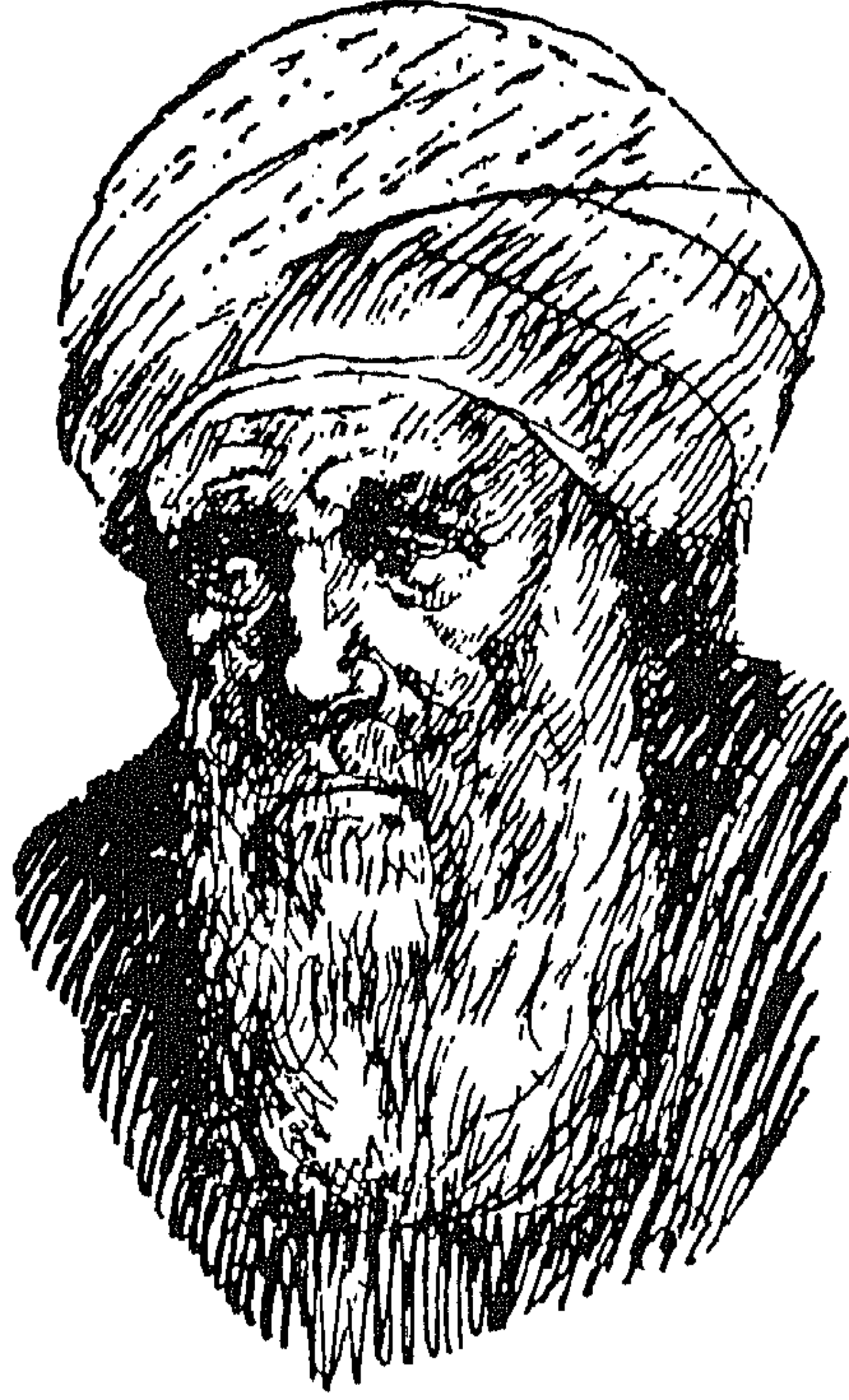
أبو العلاء المعري