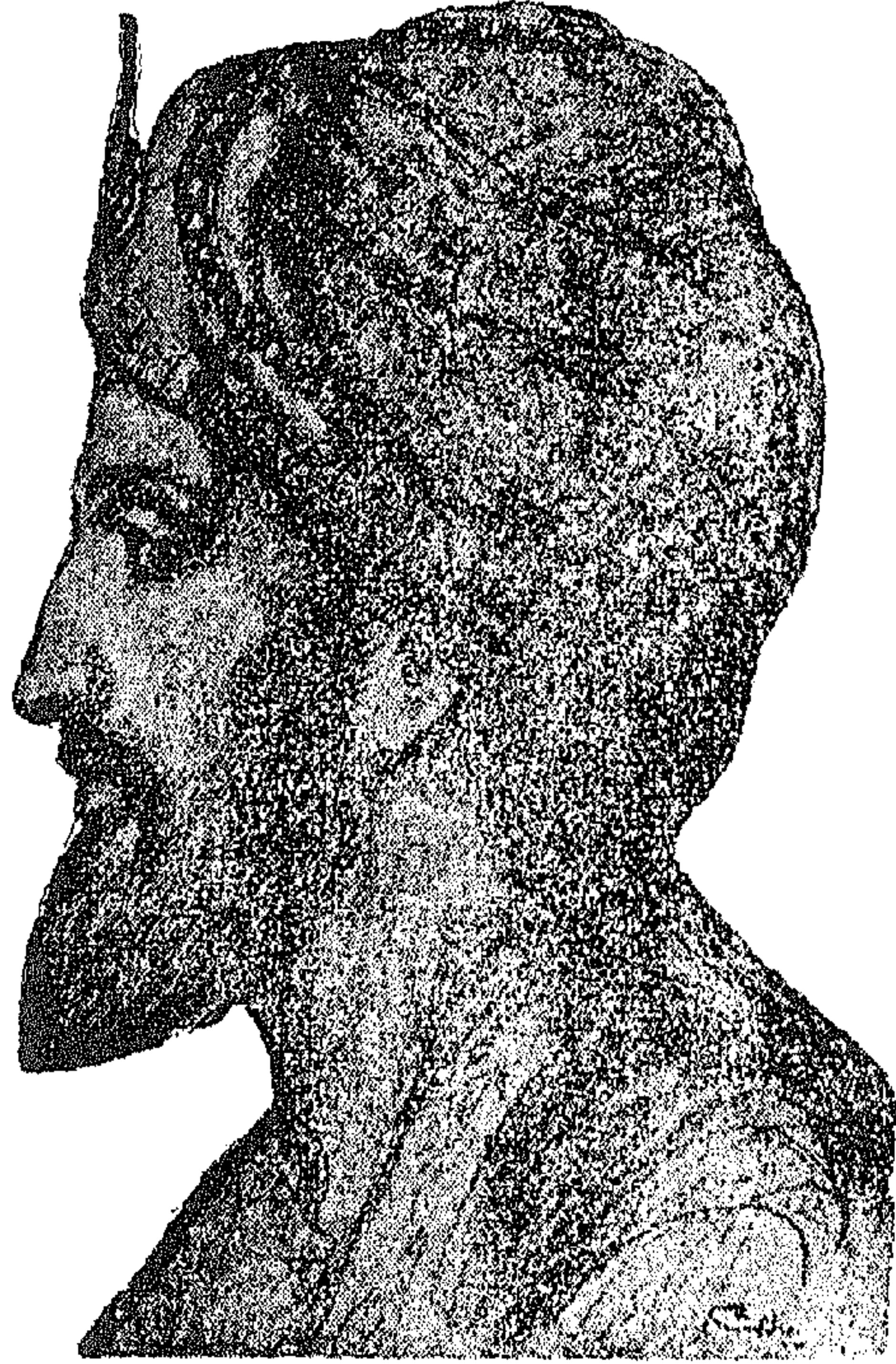
المعتمد بن عباد